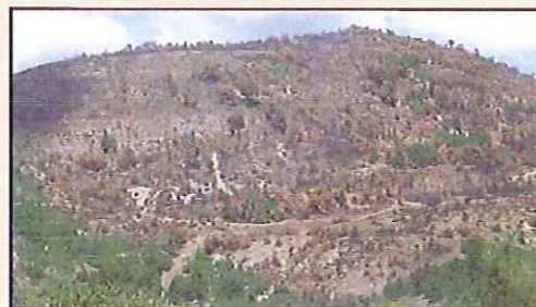
incendie à Montjay en 2004